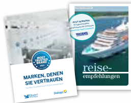
Musterbeispiele aus 2020