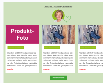
Neue Rubrik auf https://readersdigest.de