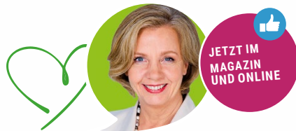
FREUNDIN. RATGEBERIN. MULTIPLIKATORIN.

Buchen Sie jetzt Ihr Empfehlungs-Inserat: antje.specht@regiosales-solutions.de / 0211 55 85 6 (0) - 14